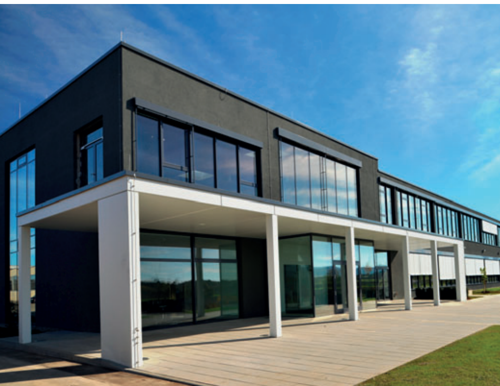
Das neue Vertriebs- und Technologiezentrum bietet insgesamt 2.000 m 2 Nutzfläche und wurde Ende 2012 bezogen.

Das daraus resultierende personelle Wachstum auf mittlerweile 105 Mitarbeiter am Standort Dormettingen brachte das Unternehmen auch räumlich an die Grenzen. Im Herbst 2012 konnte das neu errichtete Vertriebs- und Technologiezentrum auf dem Unternehmensgelände nach einer Bauzeit von 14 Monaten bezogen werden. Das zweistöckige moderne Gebäude kombiniert auf ca. 2.000 m 2 Nutzfläche traditionelle Bauelemente mit modernster Fertigteiltechnik.