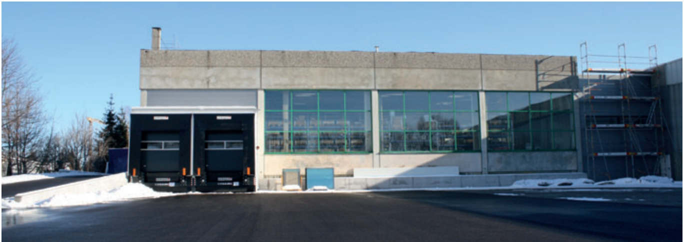
Die kürzlich zugekaufte Halle 9 des Unternehmens beherbergt das neue Hochregallager.