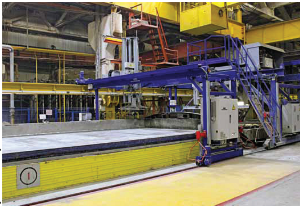
Figure: Weckenmann Anlagentechnik