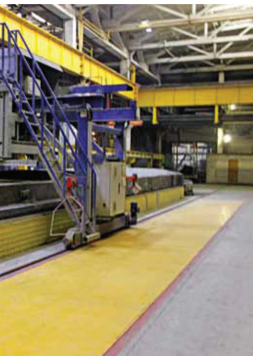
Figure: Weckenmann Anlagentechnik

Weckenmann Anlagentechnik GmbH & Co. KG Birkenstraße 1 72358 Dormettingen/Germany ☎ +49 7427 94930 info@weckenmann.com ➔ www.weckenmann.com